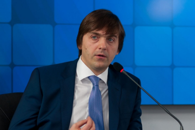
С.С. Кравцов – министр просвещения РФ

Система школьных театров и детских театральных конкурсов развивается по поручению Президента РФ и является важным инструментом воспитания подрастающего поколения и социальным лифтом для талантливых детей.